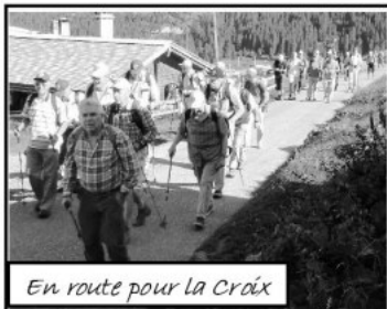
En route pour la Croix