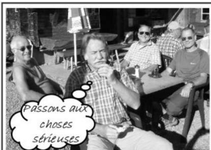
Passons aux choses sérieuses