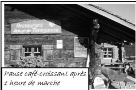
Pause café-croissant après 1 heure de marche