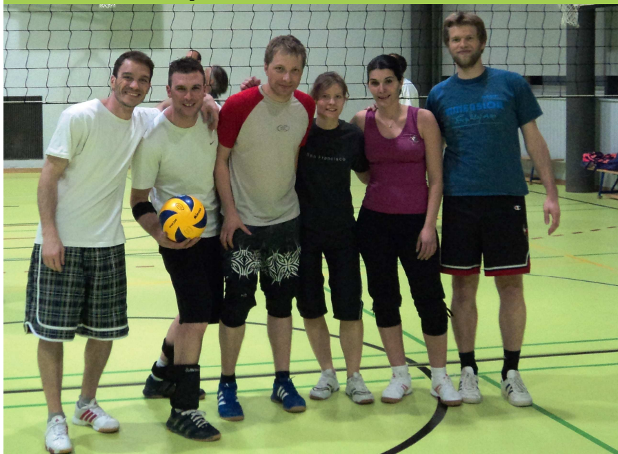
Lundi, 20:00 Grand Vennes L'avenir de la Société ?