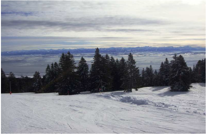
Sortie d'hiver, un autre horizon

Le tournoi de volley-ball inter-leçons s'est déroulé dans la salle de la Rouvraie le mardi 12 mars, dans une ambiance toujours très sympa. Les équipes de l'Elysée, de la Rouvraie et des Z'hums (jeunes du volley-mixte) se sont affrontées dans des parties très disputées.