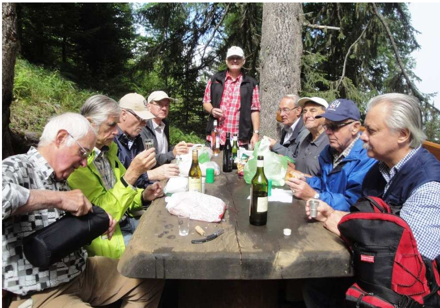
Course du groupe de montagne : Une tradition respectée !