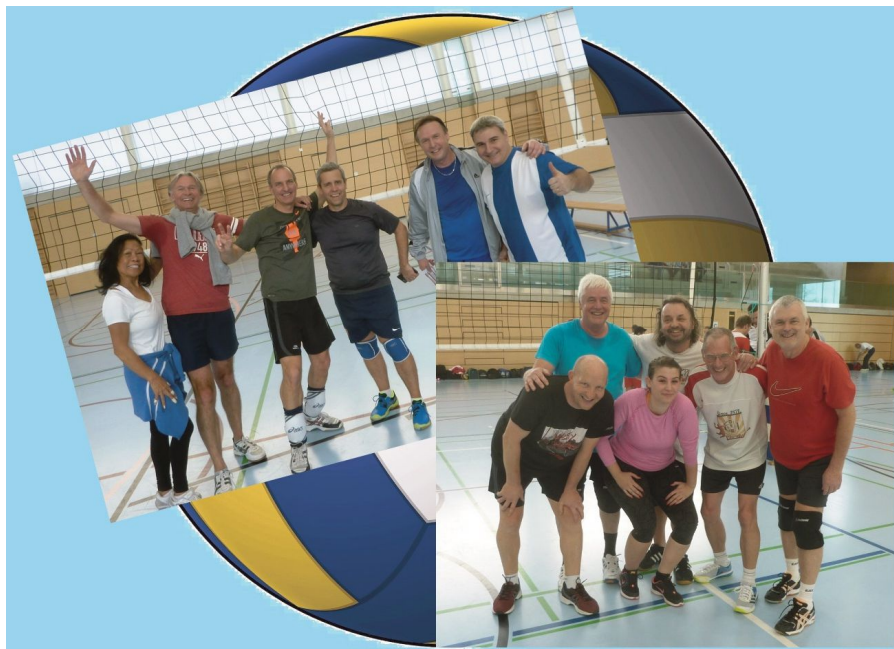
Tournoi de volley : un plaisir pour les joueurs et les spectateurs (page 3)